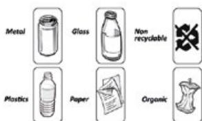
6 PEGATINAS TRI SELECTIVAS INCLUIDAS