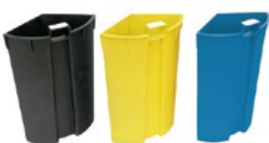
CUBOS INTERIORES DE COLORES